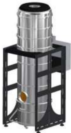
Verzia so zbernou nádobou