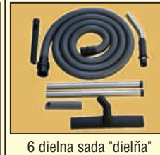
6 dielna sada "dielňa"

Pevná predná tr. 60 cm 2385-302001481 6 dielna sada "dielňa" 2385-302000927 Antist. sada MULTIFIT 38 2385-80601000