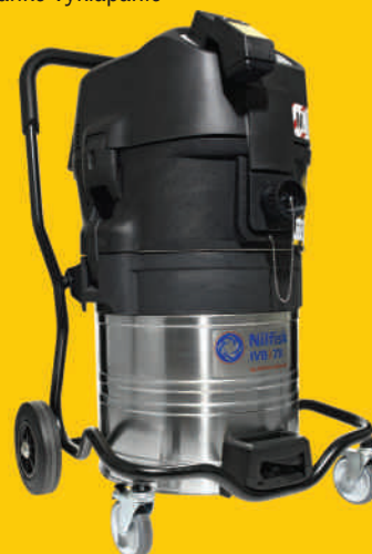
IVB 7X (ATEX 22)