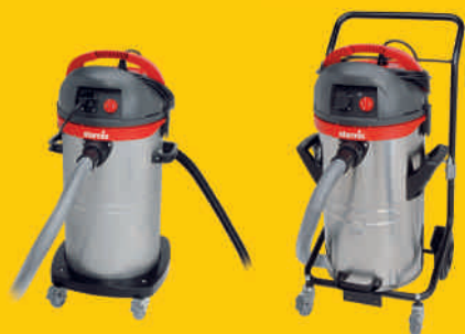
HS PA 1455