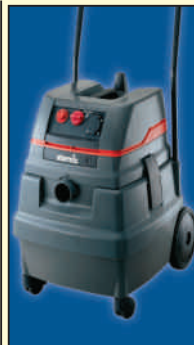
ISARD 1250/1450 EWS