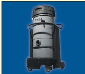
IVT 2000 S IVT 2000 B IVB 2000 S

Priemyselné vysávače s výkonom od 2 kW. Na ťažké nasadenie tam, kde sa vysávajú ťažšie materiály, oleje alebo kde je nutné dlhodobé vysávanie. Vyberte si podľa triedy prachu, výkonu alebo druhu filtra alebo sa poraďte s nami, odporučíme vám vysávač a príslušenstvo vhodné do vašich konkrétnych podmienok.