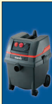
ISARD 1225 EWS