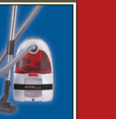
A 100 „ACTION“