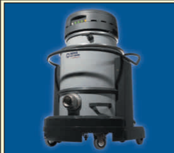
IVT 3000 S IVB 3000 S

Silný priemyselný vysávač 2000 W. Vhodné na vysávanie ťažkých materiálov. Ideálny pre kovspracujúci, potravinársky, farmaceutický a chemický priemysel, sklady a servisy. Lhké a bezpečné nakladanie s prachom. Verzia S bez sáčku do zásobníka, verzia B so sáčkom umiestneným v zásobníku.