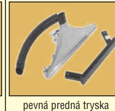
pevná predná tryska

Pevná predná tr. 60 cm 2385-302001481 6 dielna sada "dielňa" 2385-302000927 Antist. sada MULTIFIT 38 2385-80601000